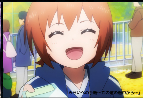
「みらいへの手紙〜この道の途中から〜」