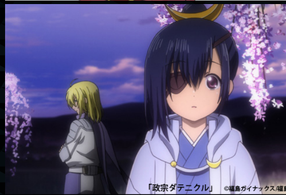
「政宗ダテニクル」 ©福島ガイナックス/福島