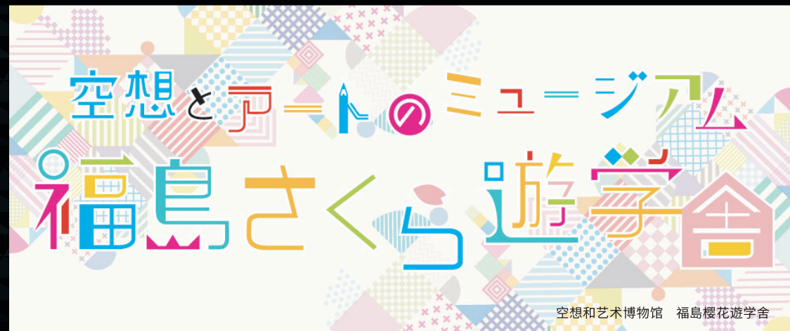
空想和艺术博物馆 福島櫻花遊学舎